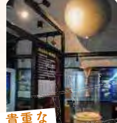
貴重な戦争遺跡の一つ

☎044-934-7993 東三田1-1-1 明治大学生田キャンパス内 日~火曜、年末年始など(最新情報はWEBサイト参照) 10:00~16:00