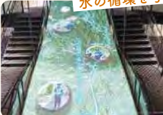
水の循環を学ぼう

☎044-911-1966 東三田5-1-1 水曜、土・日・祝日、年末年始 9:00~11:30、13:00~15:30