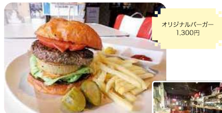
オリジナルバーガー 1,300円