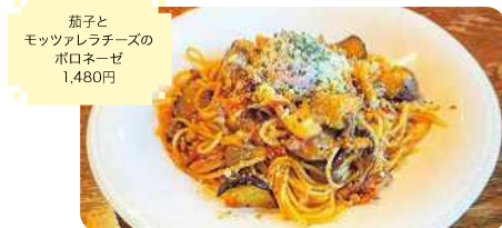
茄子とモッツアレラズのポロネーゼ 1,480円