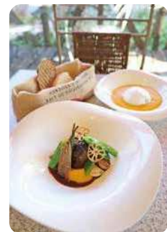
ランチセット(国産牛ホホ肉の赤ワイン煮、季節のスープ、自家製パン2種) 2,530円 ※メインは牛・鶏・魚より選択 ※プラス660円でタルトとスペシャリティコーヒーのセットを追加可