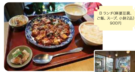
Bランチ(麻婆豆腐、ご飯、スープ、小鉢2品) 900円

044-934-1183 倉庫河原6-18-2 ランチ 11:30~15:00(L.O.14:30)、17:30~22:30(L.O.21:45) 休 土日祝はランチ11:00~、ディナー17:00~ 月(祝日の場合は翌火)、第2火または第3火