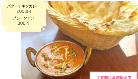
バターチキンカレー 1,000円 プレナン 300円