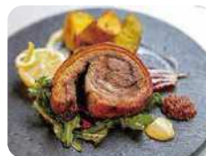
IRORI 名物 炭火焼きボルケッタ 3,280円 ポロネーゼ 1,980円