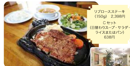
リブローズステーキ(150g) 2,398円 Cセット(日替わりスープ・サラダ・ライスまたはパン) 638円