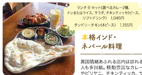
ランチ日セット(選べるカレー2種、ナンまたはライス、サラダ、チキンティッカ1ピース、ソフトドリンク) 1,045円 タンダーチキン(4ピース) 1,155円