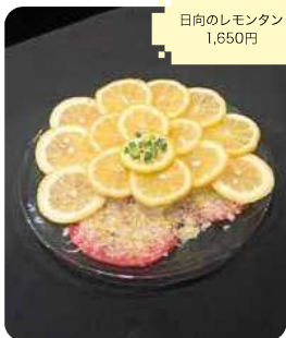
日向のレモンタン 1,650円

たまグルメバリアフリーマーク 駐車場あり エレベーターあり P21-22 MAP位置