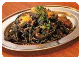
海鮮黒ナポリタン 830円 鶏塩煮込み 330円