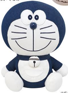
デニムドラえもん ぬいぐるみ