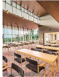
広々としたレストラン

川崎国際生田緑地ゴルフ場 予約☎044-934-1555 代表☎044-934-0015 桁形7-1-10 クラブハウス開場6:30~ 元日休場、年間数日不定休あり 料金についてはHPまたは問い合わせを